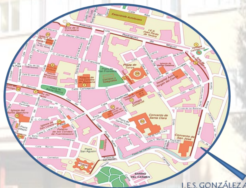
I.E.S. GONZÁLEZ ALLENDE Avda. Allende 21. 49800 TORO